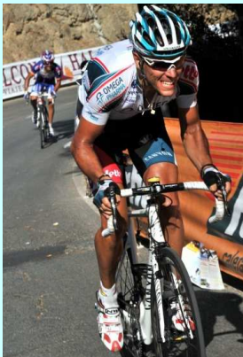
Philippe Gilbert hacia la victoria en la etapa de Málaga - Vuelta 2010

La Clásica de Semana Santa nos llevará este año a conocer a fondo la Serra del Montsant , tierra de buen vino (Priorat) y excelente aceite de oliva, paraíso de la escalada y el excursionismo y, como podremos ver, del ciclismo-espectáculo . Tras abandonar Ulldemolins en suave ascensión para ir entrando en calor, descenderemos por Margalef y la Bisbal de Falset mientras disfrutamos del increíble paisaje. La ascensión a la Figuera servirá para hacer una primera selección, mientras que la breve subida a Gratallops servirá para calibrar fuerzas de cara a las decisivas ascensiones a la Morera de Montsant y a Siurana , donde repondremos fuerzas con un papeo a pie del castillo árabe. Tras contemplar el famoso Salto de la Reina Mora (precipicio en el que aún puede verse la profunda marca de la herradura del caballo de la reina mora Abdelazia, hija del señor de Siurana, que al llegar las tropas cristianas prefirió saltar al abismo con su caballo que caer en manos enemigas), regresaremos por el suave coll d'Albarca , que será testigo de los últimos palos de la jornada para romper el grupo antes del breve descenso a la línea de meta, situada en Ulldemolins .